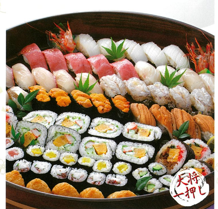
※人数に合わせてお作りいたします。ご相談ください。